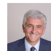
HERVÉ MORIN Président de la Région Normandie

Pour ce faire, le Pacte prévoit que la Région puisse mobiliser 337 millions d'euros au titre du Plan national d'Investissement dans les Compétences entre 2019 et 2022. Ajoutés au budget régional annuel de 127 millions d'euros, ce sont au total 843,8 millions mis en œuvre par la Région Normandie sur 4 ans pour proposer 128 000 places de formation , contribuer à la montée en qualification des Normands et répondre aux besoins de recrutement sur les territoires.